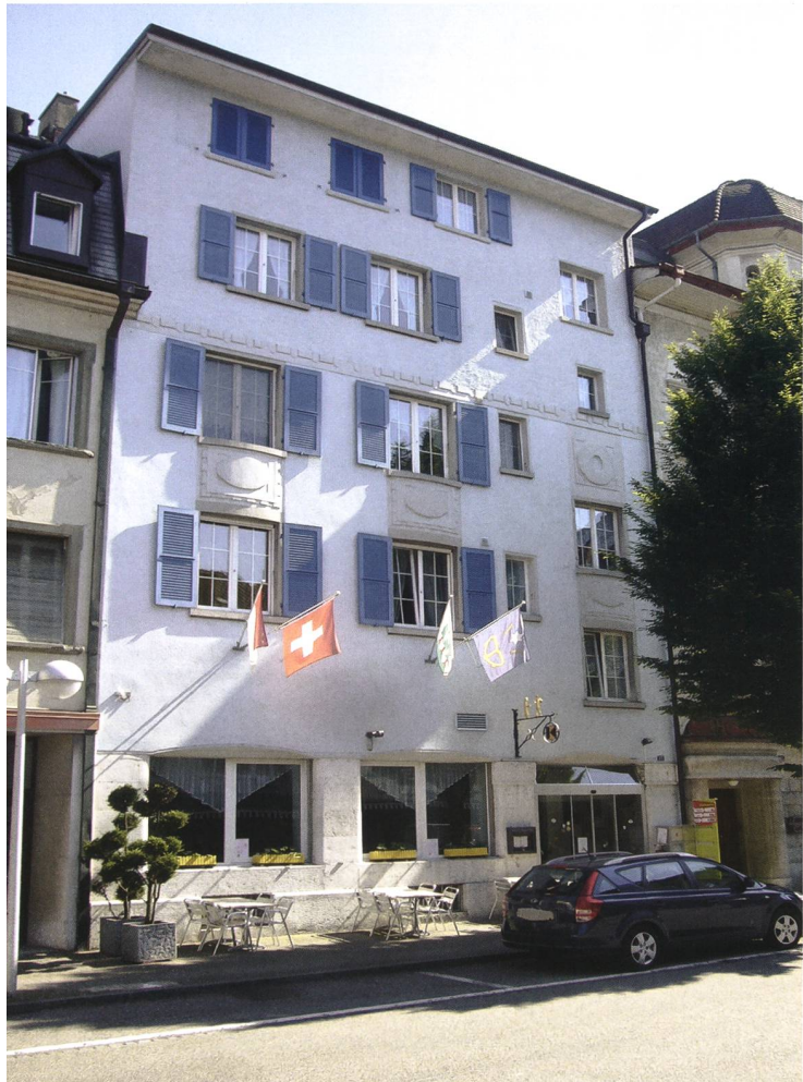
Das heutige Restaurant Kolping, bis 1985 Gesellenhaus Olten