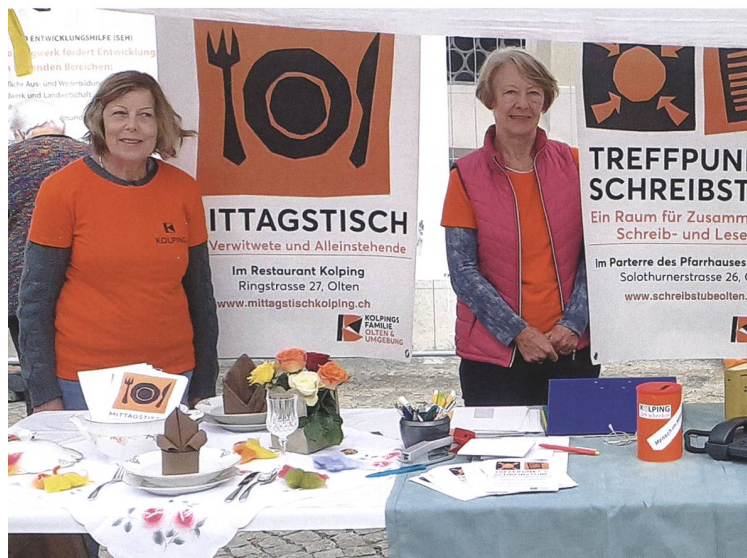
Kolpingtag 2019 in Zofingen: Mitglieder der Kolpingfamilie Olten stellen die Projekte vor.