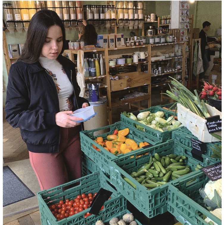
Mein Besuch in der Marktecke Olten

Bea Johnson gilt als Begründerin dieser Bewegung, die sich gegen unnötigen Abfall und Verschwendung richtet. Johnson hat in ihrem Buch «Zero Waste Home» beschrieben, wie sie als 30-Jährige ihren Lebensstil komplett auf den Kopf stellte. Sie schaffte mit ihrer Familie den Wechsel von einer verschwenderischen Lebensart zu einem müllfreien, achtsamen Lebensstil. Ihre Philosophie erklärt sie in ihrem Buch, welches im Jahr 2016 erschienen und seither millionenfach verkauft worden ist. 1 Es inspiriert viele Menschen, auch in der Schweiz, und motiviert sie, bewusster zu konsumieren. So wurde zum Beispiel im Herbst 2017 der Laden Unverpackt in Aarau gegründet. In Olten eröffnete im Sommer 2019 die Marktecke. Beide Läden bieten die Möglichkeit, unterschiedliche Produkte ohne Verpa-