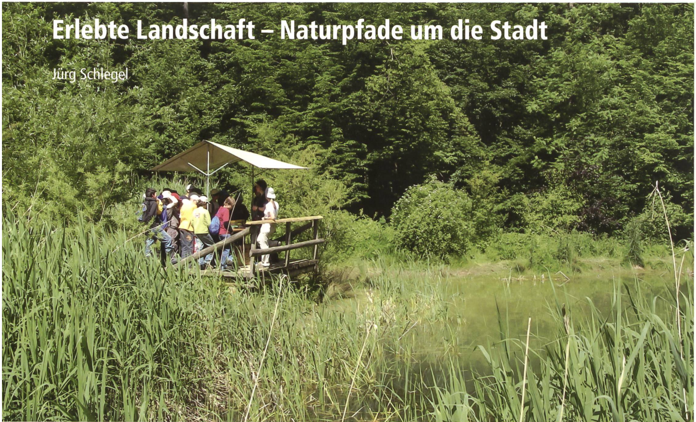
Walderlebnispfad - Schulklasse am Seidenhoflochweiher

«Du wirst in den Wäldern vieles mehr finden als in den Büchern.» Bernhard von Clairvaux (12. Jh.)