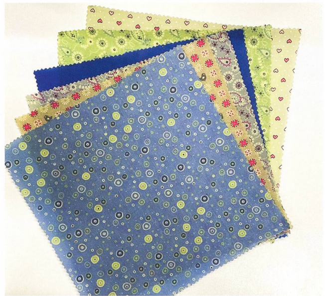
Von BEECOLO hergestellte Frischhalttücher aus recyceltem Stoff und Bienenwachs

Die Zeit war knapp: Nur einen Monat, um einen Stand zu planen, zu gestalten und zu koordinieren. Doch statt sich wegen der knappen Zeit entmutigen zu lassen, zogen wir alle an einem Strang. Dank unzähliger Ideen kamen schliesslich unsere einzigartigen Verkaufsstände zustande. Am Samstag, 1. April 2023, begann die Nationale Handelsmesse. Vom 1. bis zum 5. April durften 75 Unternehmen ihre Produkte präsentieren. Wiederrum standen wir vor einer grossen Herausforderung: Wie sollten wir sicherstellen, dass unser Stand inmitten der geschäftigen Passanten auffallen und die potenzielle Kundschaft anziehen würde? Die Fussgängerinnen und Fussgänger schienen keine Zeit zu haben, um