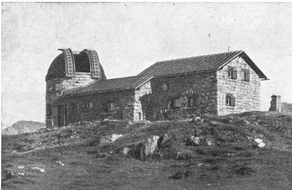
Abb. 1. Das astrophysikalische Observatorium Arosa

Im Jahre 1939 wurde als Zweigstation der Eidgen. Sternwarte und damit als ein Institut der Eidgen. Technischen Hochschule auf Initiative des Verfassers auf dem Tschuggen bei Arosa in 2050 Meter über Meer ein neues Observatorium erbaut, auf dem in erster Linie die Sonnenkorona und die Protuberanzen erforscht werden sollten. Dieses Programm stellte eine den instrumentellen und methodischen Fortschritten entsprechende zwangsläufige Fortsetzung der auf der Zürcher Sternwarte zur Tradition gewordenen Sonnenbeobachtungen dar. Es erforderte eine Höhenstation, weil die Erforschung der Korona nur in reiner Höhenluft möglich ist, und ein besonderes Instrumentarium, Koronograph, das sich durch Streulichtfreiheit auszeichnet. Dieses konnte aus Mitteln der Wolfstiftung und der Stiftung für wissenschaftliche Forschung an der Universität Zürich erbaut werden, während für das Observatorium selbst ein durch Ablösung eines in kluger Voraussicht von Prof. Wolf, dem ersten Direktor der Zürcher Sternwarte, über die Unverbaubarkeit der Meridianrichtung abgeschlossenen Servitutes entstandener Baufond verwendet werden konnte.