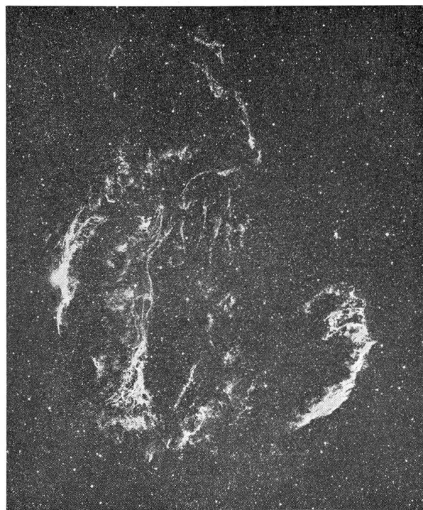
Der Cirrus-Nebel im Cygnus. – Links NGC 6992 + 6995, oben 6979, rechts 6960. Aufnahme: 1.3 m-SCHMIDT-Kamera der Palomar-Sternwarte. Palomar Sky Atlas.

Der Cirrus-Nebel ist ausserdem eine starke Quelle der radiofrequenten Strahlung : auf der UKW-Frequenz von 100 \text{ MHz} bestrahlt er uns nur achtmal schwächer als der Krebs-Nebel.