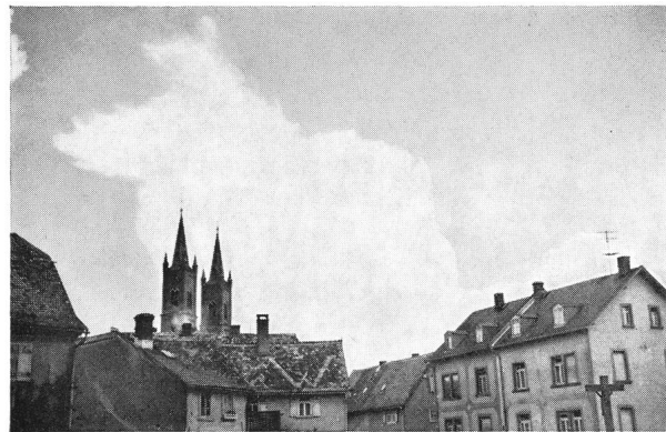
Abb. 4: Cumulo-Nimbus, der zu «rauchen» anfängt (die Ränder fransen aus). Gewitterneigung!

Für die Schweiz mögen die Verhältnisse ein wenig günstiger liegen als eben dargestellt. Tessin und Engadin, aber auch das Wallis sind begünstigter als etwa Graubünden, wie Sie aus dem täglichen Wetterbericht wissen werden. Als Trost mag gelten, dass schliesslich auch die heiteren Abende noch genutzt werden können. Wolkenlosigkeit ist oft gar nicht erforderlich.