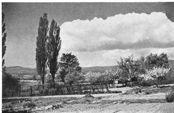
Abb. 3: Quell-Cumulus. Diese Wolke ist noch harmlos, vor allem, wenn sie allein auftritt und nicht als Wand herankommt.

Nachdem ich nun etwas weiter ausholte – es musste geschehen, um die weiteren Ausführungen besser verstehen zu können –, so wollen wir jetzt zum eigentlichen Thema vordringen. Aus dem Dargelegten geht hervor, dass die zauberhaften Abende, an denen keine Wolken am Himmel stehen und die den ungehinderten Blick zu anderen Welten erlauben, nicht allzu häufig sind. Wenn man sich die Frage vorlegt, wieviele wolkenlose Abende an einem bestimmten Orte auftreten, so kann sie nur auf Grund langjähriger Statistiken beantwortet werden. Natürlich weiss man, dass im März mehr solcher Abende auftreten als im November, aber das befriedigt nicht. Aus Beobachtungen von 32 Jahren auf etwa 50° Nordbreite und einem Band von 4 Längengraden, beginnend an der Mainmündung gegen Osten zu wurden rund 2000 Abende innert des genannten Zeitraums ohne Wolken festgestellt. Dass verschiedene Stationen dabei gut übereinstimmten, zeigt, dass vor allem die Grosswetterlage massgeblich an diesem Ergebnis beteiligt ist. In zweiter Linie spielen lokale Eigenheiten mit. Der Jahresdurchschnitt lag bei 66 wolkenlosen Abenden, wobei der Kleinstwert bei 23, der Höchstwert bei 148 liegt! Also eine Spanne von 1:6! Gegenwärtig würde die Wahrscheinlichkeit nach dem Dargelegten wohl niedriger liegen, weil eben die geschilderte Verschlechterung allgemeiner Art eintrat.