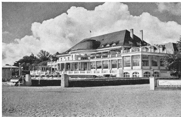
Abb. 2: Schönwetter-Cumulus, in Quellform übergehend (über dem Casino von Travemünde).

Inzwischen kamen noch andere Momente hinzu. Der russische Meteorologe BUDYKO fand, dass seit 1950 bis heute die einkommende Sonnenstrahlung um 3–4% geringer geworden ist. Grund: Die atmosphärische Verschmutzung! Dabei wird diese bis rund 130 km von einer Großstadt hinweg verschleppt. Bei stärkerem Wind reicht diese als air pollution bekannte Erscheinung nicht ganz so weit. Im allgemeinen ist die Sichtweite, aber in gewissem Masse auch die relative Luftfeuchte ein guter Anzeiger für die Luftreinheit.