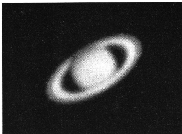
Fig. 2: Saturne le 4. 11. 1972.

Ombre du globe sur les anneaux L'ombre était bien visible, soit avant, soit après l'opposition.