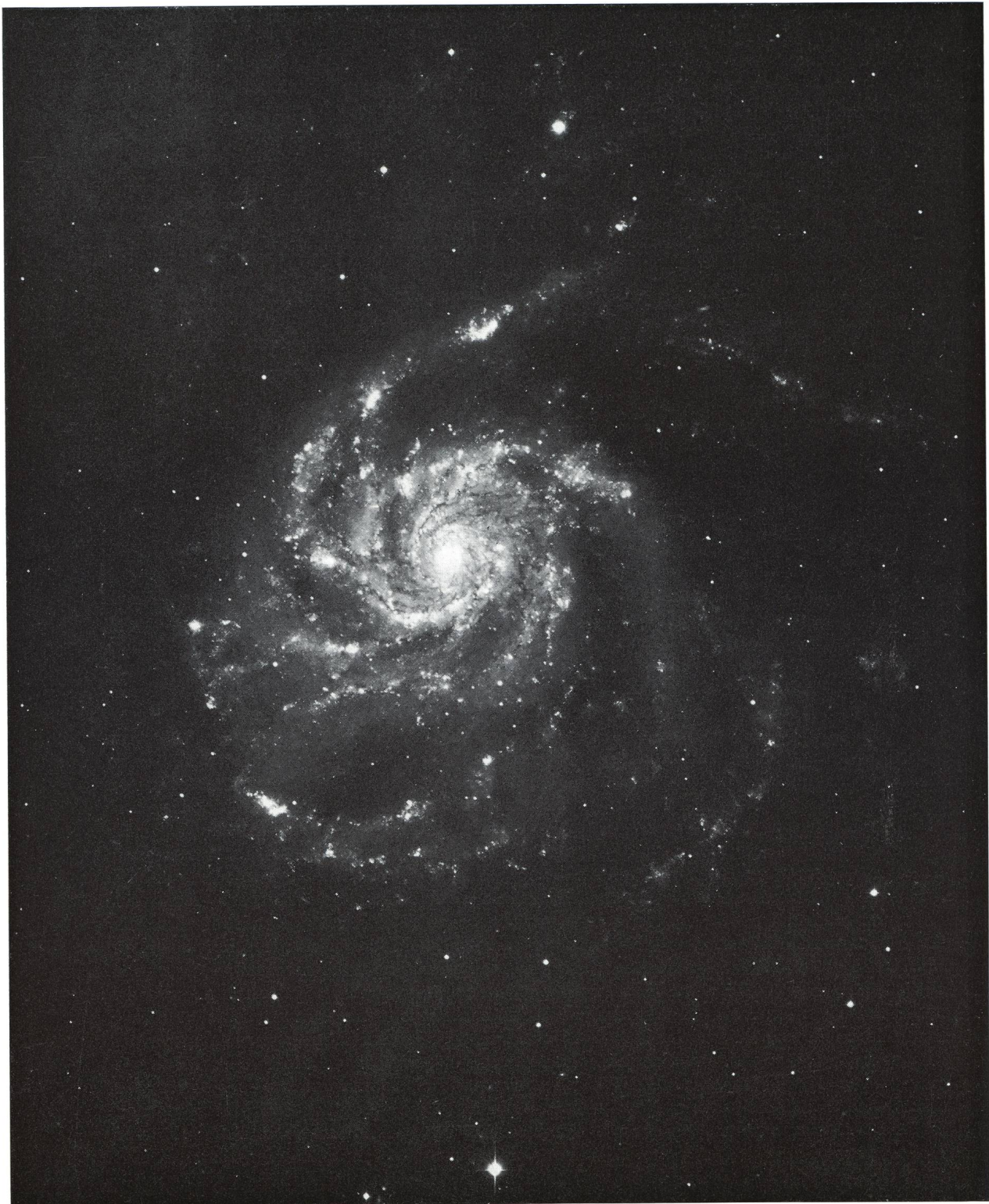
Beispiel einer Aufnahme mit dem im Titelbild dieser Nummer gezeigten grossen Teleskop des U. S. Naval Observatory in Flagstaff:

M 101, aufgenommen am 12. Mai 1964 auf 103 a O ohne Filter. Belichtungszeit: 2h45m. Man beachte die hervorragende Durchzeichnung auch der äusseren Teile der Spiralarme und die gestochene Schärfe der schwächsten Sterne.