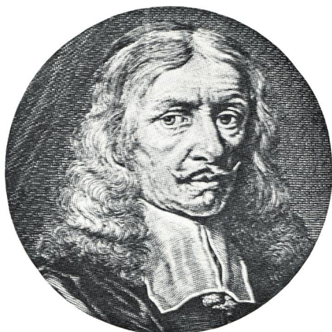
Fig. 1: JOHANN HÉVÉLIUS (1611–1687). D'après une gravure publiée dans «L'Astronomie Populaire» par CAMILLE FLAMMARION (Edition 1955).

Trois quarts de siècle plus tard, à Augsbourg, le pasteur JEAN BAYER (1573–1625) établit un atlas stellaire où il désigna les étoiles de chaque constellation par des lettres grecques. Ici encore, le résultat ne fut obtenu qu'au prix d'un travail patient et mené avec ordre. Les désignations de BAYER sont encore en usage aujourd'hui.