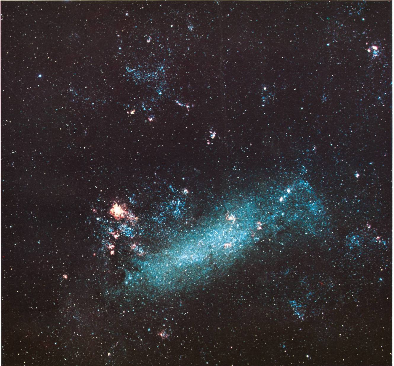
Abb. 3: GROSSE MAGELLANSche Wolke. Aufnahme mit MAK-SUTOV-Kamera 150/200, f = 350 mm. Belichtungszeiten: Blau: 20 Min., Grün: 28 Min., Rot: 35 Min. (oben)