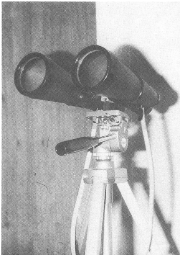
Abb. 1: Der Feldstecher als Beobachtungsinstrument (20 x 70 mm)

Zu dieser «grossen Zahl von himmlischen Objekten» gehören zweifelsohne die Veränderlichen Sterne. Hier kommt der Feldstecher vorzüglich zum Einsatz. Denn neben der grossen Lichtstärke, dem grossen Gesichtsfeld (wichtig zum Aufsuchen des Sterns), bietet der Feldstecher eine leichte Handhabung und leichten Transport, um dem Licherdom der Großstädte entfliehen zu können. (s. Abb.1)