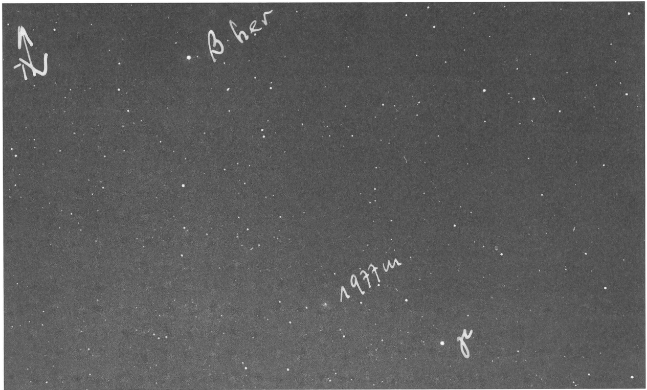
Diese früheste fotografische Aufnahme des Kometen KOHLER wurde der ORION-Redaktion von Dipl.-Ing. F. SEILER aus München zugestellt. Die Aufnahme stammt vom 30. September 77, 19h30 MEZ. Aufgenommen wurde sie auf Kodak 103aO mit der Maksutow-Kamera 150/200/350. Belichtungszeit: 1 Minute.