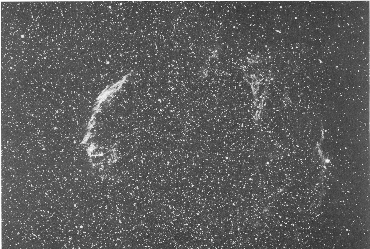
Bild 2 «Cirrus-Nebel (Dentelle)». (NGC 6992-5, 6960, 6979). 12 min. auf Kodak 103a-E + Filter WR 29. Schmidt-Kamera Celestron 8 (1.5/20/305).

Ce qui frappe le plus dans cette constellation, ce sont les champs stellaires très riches de la voie lactée qui se déroule comme une bande blanche au-dessus de nos têtes. C'est précisément dans le Cygne qu'elle se partage en deux bras, l'un allant vers l'Aigle, l'autre vers l'Ophiuchus. L'objet le plus célèbre du Cygne est cer-