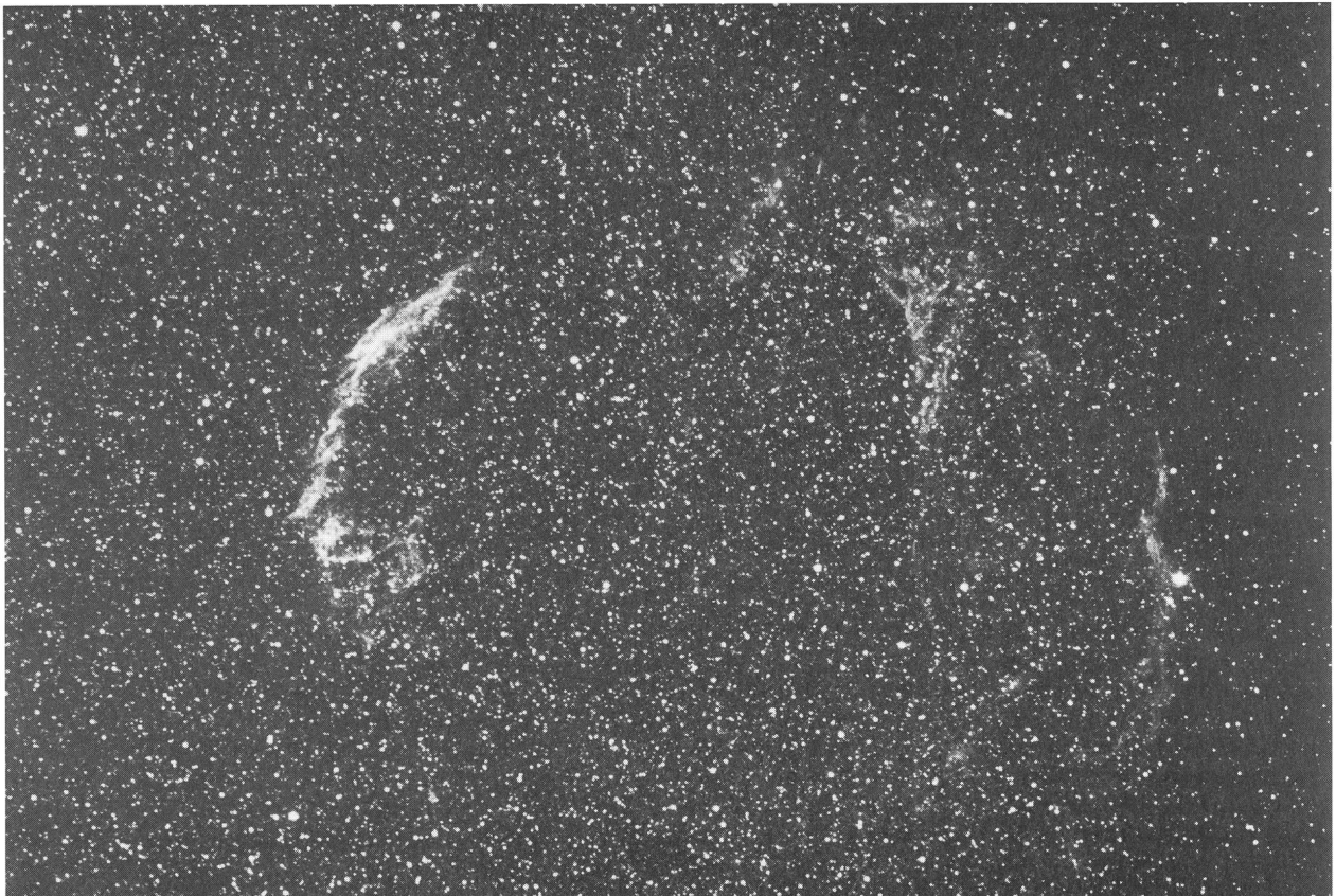
Bild 2 «Cirrus-Nebel (Dentelle)». (NGC 6992-5, 6960, 6979). 12 min. auf Kodak 103a-E + Filter WR 29. Schmidt-Kamera Celestron 8 (1.5/20/305).

Ce qui frappe le plus dans cette constellation, ce sont les champs stellaires très riches de la voie lactée qui se déroule comme une bande blanche au-dessus de nos têtes. C'est précisément dans le Cygne qu'elle se partage en deux bras, l'un allant vers l'Aigle, l'autre vers l'Ophiuchus. L'objet le plus célèbre du Cygne est cer-