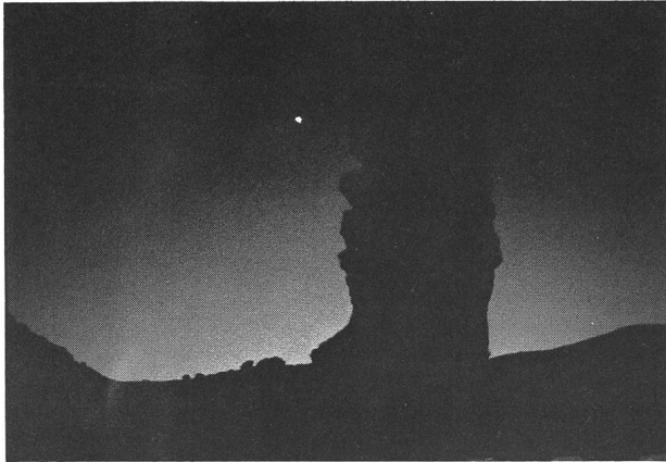
Abb. 1: 200 mm-Objektiv; Blende 3,5; Belichtung 5 s; Agfachrome CT 18. 2. 4. 78, Venus und Merkur am Abendhimmel ca. 20 min nach Sonnenuntergang. Merkur befindet sich rechts vom grossen Felsen ganz dicht über dem Horizont.