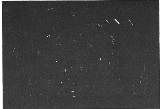
Abb. 2: 55 mm-Objektiv; Blende 1,8; Belichtung 30 min; Agfachrome CT 18. Bei den beiden hellsten Strichspuren handelt es sich um \beta und \gamma Ursae minoris. 2. 4. 78.

spricht dort wirklich nur spanisch) kann es in jeder Hinsicht bestens empfohlen werden (Übernachtung mit Frühstück kostet ca. Fr. 30.— für ein Doppelzimmer).