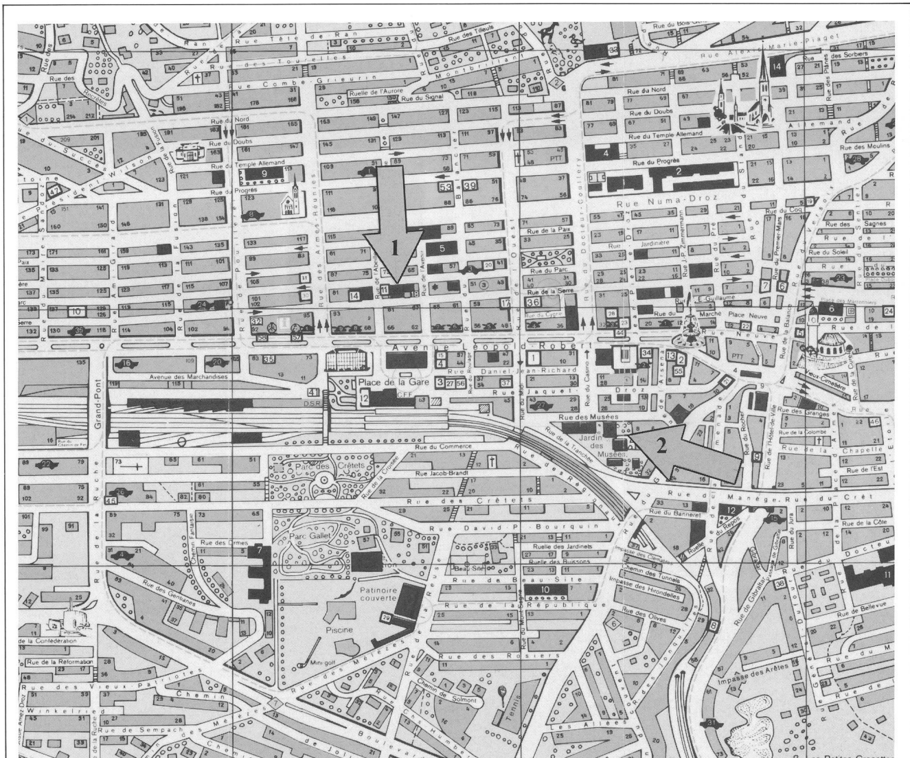
1 Maison du Peuple 2 Uhrenmuseum