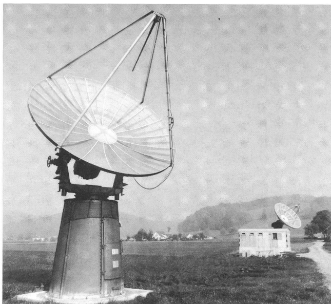
Abb. 1: Die Antennenanlage und Meßstation bei Gränichen wurde im Herbst 1979 in Betrieb genommen.

Zwei Parabolreflektoren von 5 und 7 m Durchmesser und logarithmisch-periodische Primärstrahler dienen als Antennen. Die ganze Anlage steht bei Gränichen, südlich von Aarau. Sie arbeitet vollautomatisch, kann aber via Telefon von Zürich aus überwacht werden.