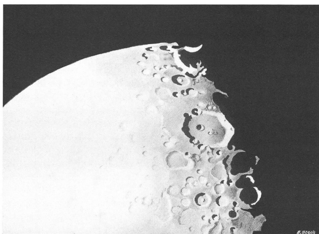
Zeichnung des Kraters Clavius vom 11. September 1959, 20.00 bis 21.00 Uhr. Instrument 61/810 F = 18, Barlowlinse 90-fache Vergrösserung.

Nicht allein des Nichtvermögens der Forderung fotografischer Aufnahmen als vielmehr der Kritik wegen, die diese nicht haben, begann ich das gesehene Motiv zu zeichnen. Mein bescheidenes Zeichentalent verhalf mir zu den Aufnahmen, die ich am Fernrohr skizzierte und später ins