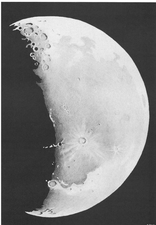
Mondbeobachtung vom 6. November 1955 zwischen 02.00 bis 02.45 Uhr.

Heute vor vierzig Jahren sah ich das erste Mal den Mond durch mein selbstgebautes Fernrohr aus Holz, Blech und Kartonröhren mit einer Objektivlinse von 20mm wirksamer Öffnung und etwa 100cm Brennweite. Ich sah also