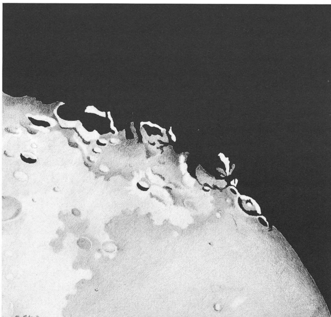
Zeichnung der Krater Grimaldi und Hevelius vom 20. Mai 1959, 20.00 bis 21.00 Uhr. Instrument 47/1000 F = 20, Barlowlinse 110-fache Vergrösserung.