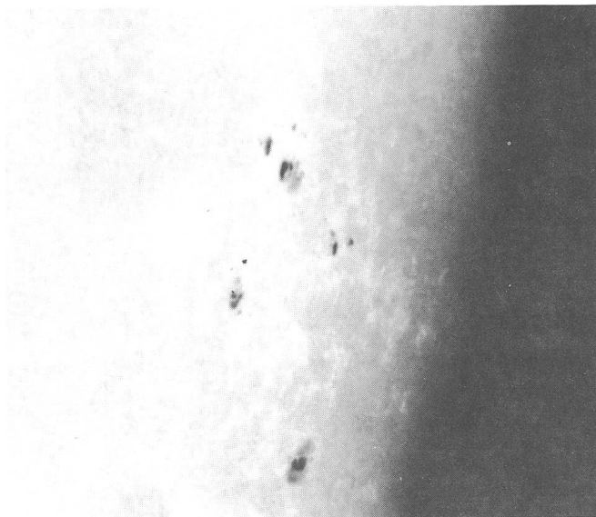
Abb. 2: Westrand der Sonne am 10.7.1979 mit Fackelgebieten und Sonnenflecken.

spezielle Protokollblätter entwickelt: a) «Fackelaktivität» b) «Fackelbeobachtungen» (Typ, Helligkeit etc.) und c) «Fackelmessungen». Die einzelnen Mitarbeiter schicken ihre ausgefüllten Listen monatlich zur Auswertung an den Verfasser, wobei es natürlich nicht zwingend ist, dass sich ein Mitarbeiter an sämtlichen Teilprogrammen beteiligt. Von hier aus