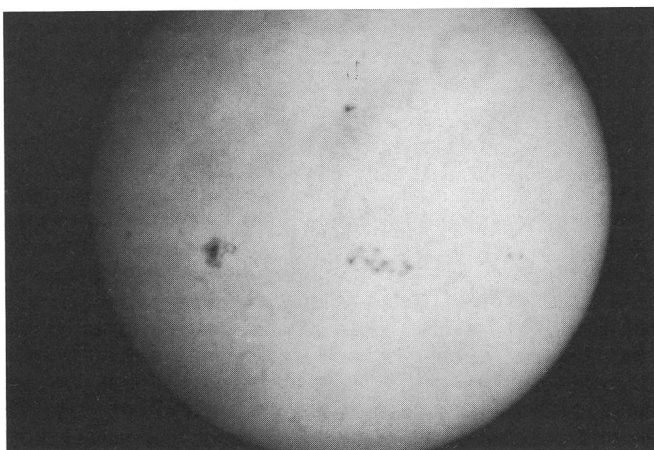
Sonnenflecken vom 19.6.1982

noch besser! Nun, wer möchte noch bei der Ergänzung mit dabei sein?