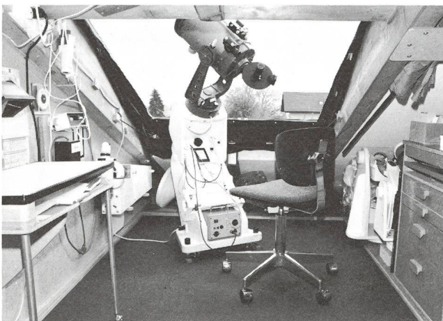
Innenansicht der Beobachtungsstation mit der selben Montierung. Ganz links im Bild ist ein dreibeiniger Rolltisch zu sehen, der unmittelbar an die Montierung für das Zeichnen am Okular herangezogen werden kann.

Die Umgebungstemperatur-Unterschiede sind für das «Seeing» wichtig. Es ist erstaunlich, wie schnell sich die Dach-