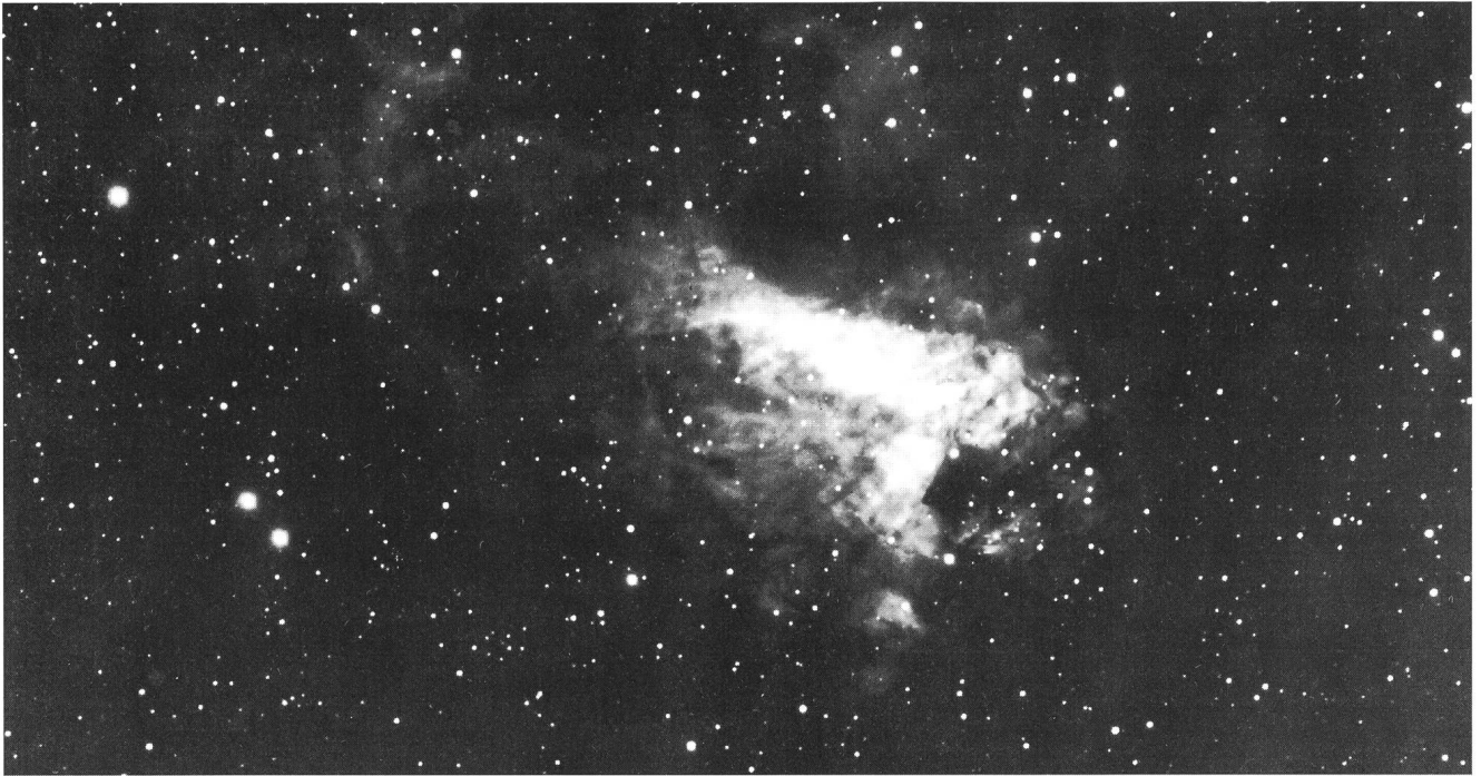
Der Gasnebel M 17 (Omeganebel) aufgenommen von Dany Cardoen mit seinem 1-m-Teleskop in Puimichel durch einen dreilinsigen Feldkorrektor auf TP 4415 H.