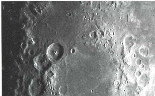
Theophilus - Cyrillus - Catharina - Mare Nectaris.

A. BAERFUSS, Mont Noble 22, CH-3960 Sierre