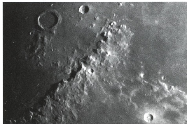
Archimedes - Apeninnen - Montes Haemus.