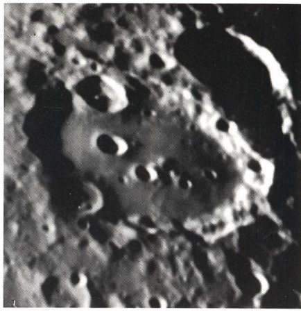
Mondkrater Clavius, fotografiert mit Vixen FL-80 S

Die Vixen-Erfolgsformel für Freude an der Astronomie