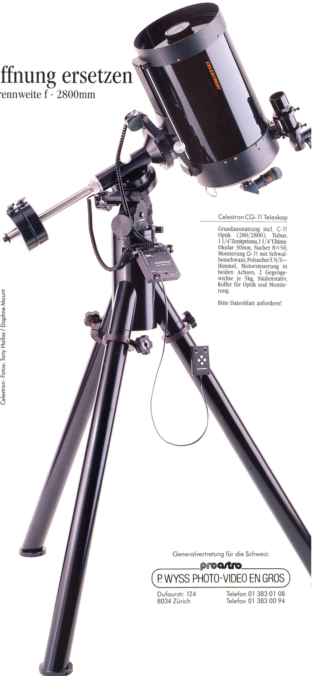
Celestron CG-11 Teleskop

Grundausrüstung incl. C-11 Optik (280/2800), Tubus, 1 1/4" Zenitprisma, 1 1/4" Ultima-Okular 30mm, Sucher 8x50, Montierung G-11 mit Schwalbenschwanz, Polsucher f.N/S-Himmel, Motorsteuerung in beiden Achsen, 2 Gegengewichte je 5kg, Säulenstativ, Koffer für Optik und Montierung.