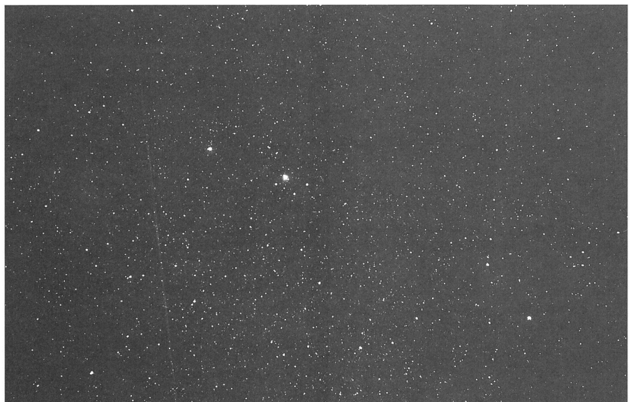
Bild 1 Komet C/1996 Q1 (Tabur) im Sternbild Zwillinge. Der helle Stern rechts unten ist, u Gem, links vom Kometen steht ε Gem. Oberhalb des letzteren ist noch NGC 2266 erkennbar. Aufnahme mit Teleobjektiv f=200 mm abgeblendet auf 1:4, von 4 Uhr 31 bis 4 Uhr 41 MESZ am 27. September 1996, während der totalen Mondfinsternis.

Es ist von Vorteil, mehr als drei Haltesterne zu verwenden, da dadurch die Genauigkeit erhöht wird. Es können so auch konkrete statistische Angaben über die Genauigkeit ermittelt werden, und Fehleingaben werden offensichtlich. Nun hat man aber zu viele Gleichungen für die Bestimmung der Aufnahmekonstanten. Mit Hilfe der Methode der kleinsten Fehlerquadrate werden die wahrscheinlichsten Konstanten A bis F bestimmt.