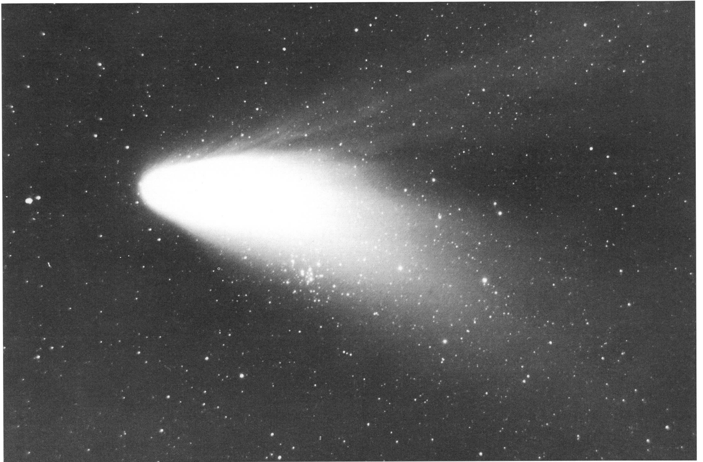
Komet Hale-Bopp und M34 am 7. April 1997 △ 5 Minuten auf TP 6415 hyp. mit Tele f32 cm/1:4. KARL OBERLI Berchtoldstr. 29, CH-3000 Bern