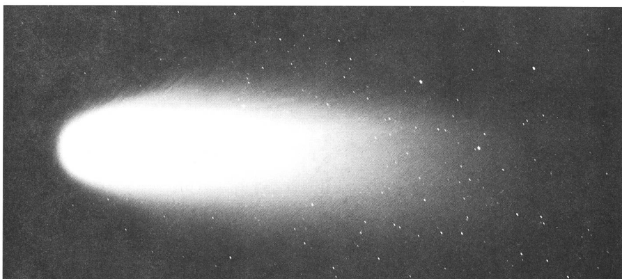
Figure 3: La comète Hale-Bopp photographiée avec le télescope Houghton 130/150/500, le 17.03.97. Pose 12 min. sur TP 2415 Hypers.