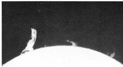
Fig. 2: Protuberanzen am Sonnenrand, wie sie bei aktiver Sonne mit dem H \alpha -Filter 0,07 und 0,15 nm oft beobachtet werden können.