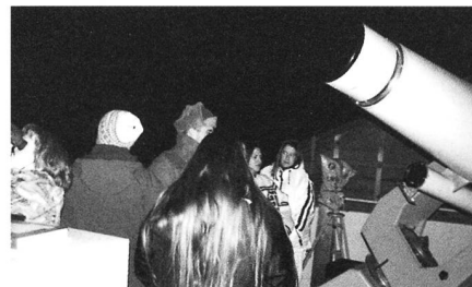
SAG Jugend-Weekend 1997