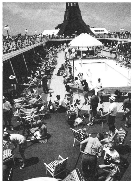
Fig. 2: «Eclipse travelers» zu Hunderten warten auf den Decks der «Norwegian Sea» auf das grosse Ereignis.

Eine Sonnenfinsternis als echtes Massenerlebnis – das hatte für uns insofern einen ganz besonderen Stellenwert, als wir dabei den totalen Gegensatz zum «einsamsten» unserer Finsterniserlebnisse kennenlernten: zur Finsternis vom 18. März 1998. Da erlebten wir im tiefsten... Westborneo am Ufer eines trägen Urwaldflusses in Gesellschaft einiger Einheimischer die glanzvolle Finsternis mit den vier schön um die Sonne verteilten, flammenden Protuberanzen. Der Himmel war wolkenlos – und dies im Regenwald, den niemand sonst als Ziel einer