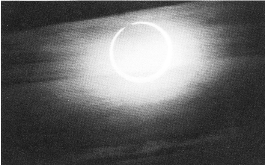
Fig. 2: Nur 4 Sekunden nach Ende der Ringförmigkeit belichtete THOMAS BAER am Abend des 10. Mai 1994 in Khourigbah, Marokko diese Aufnahme mit einem 800 mm-Teleobjektiv \frac{1}{1000} s, bei Blende 22, auf Kodackrome 64. Dank des tiefen Sonnenstandes und feiner Cirrusbewölkung war kein Filter mehr nötig.

sogenannte «Baily's Beads». Mit fortschreitender Dauer wird der Lichtring konzentrischer, ehe sich diese perfekte Geometrie wieder auflöst. Schon berührt der gebirgige Mond- den Sonnenrand von innen. Die Ringphase ist in diesem Moment zu Ende (Figuren 2 und 3).