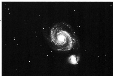
M51, T60 en Newton, 60s de pose