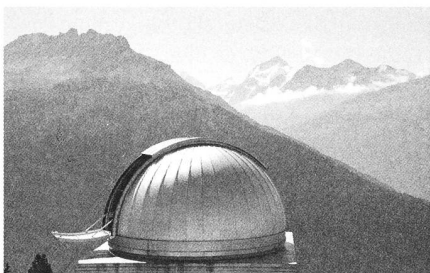
Observatoire François-Xavier Bagnoud