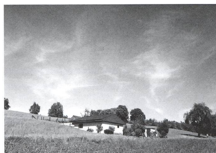
20 Jahre Sternwarte Eschenberg - 26