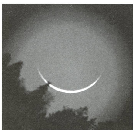
Astrofotographie / DANIEL CEVEY - 28