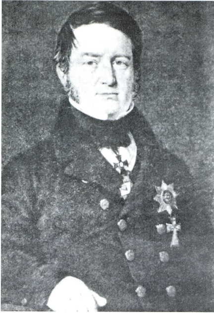
Fig. 2: FRIEDRICH GEORG WILHELM STRUVE (15.4.1793-25.11.1864)