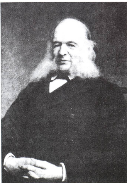
Fig. 4: OTTO WILHELM STRUVE (7.5.1819-14.4.1905)

Die Gründung des Pulkovoer Observatoriums war für die Akademische Welt von derart grosser Bedeutung, dass sehr schnell nach seiner Gründung reges Interesse an dieser neuen und zudem noch hervorragend ausgestatteten Einrichtung zur Erforschung des Universums und deren Ergebnisse entstand. Zu allen wichtigen Astronomischen Instituten der damaligen Zeit wurden rege und für die wissenschaftliche Astronomie fruchtbringende Kontakte unterhalten und gepflegt.