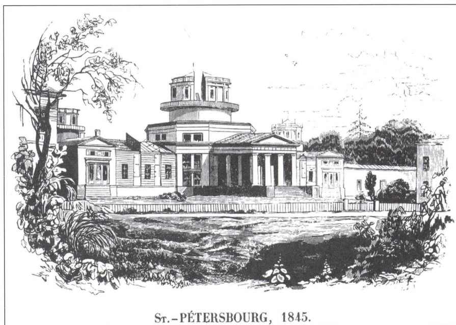
Fig. 1: Das Observatorium Pulkowo im Jahre 1845.

Zum Zeitpunkt der Lieferung der vier wichtigsten Instrumente – des «Ertelschen Transit-Instrumentes», des «Ertelschen Vertikalkreises», des «Rep-