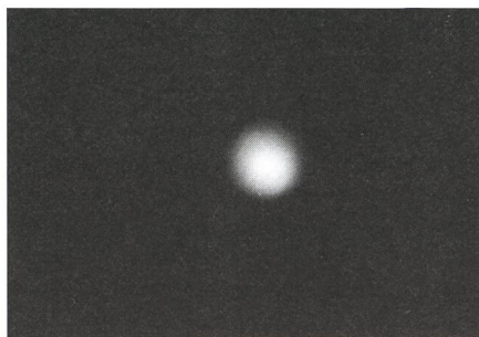
La planète Mars. Distance de 0,71UA. Diamètre angulaire de 13,2".

La planète est alors distante de 0,35UA et son diamètre angulaire est de 48,8". Photographie en projectif avec un oculaire de 25mm. Focale résultante de 8m. Ouverture F/40. Pose de 1/15s. sur film Ektar 1000. Arzier (VD) le 9 mars 1993 à 17h15.