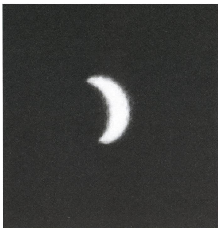
Croissant de Vénus.

La planète est alors distante de 0,35UA et son diamètre angulaire est de 48,8". Photographie en projectif avec un oculaire de 25mm. Focale résultante de 8m. Ouverture F/40. Pose de 1/15s. sur film Ektar 1000. Arzier (VD) le 9 mars 1993 à 17h15.