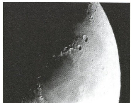
La Lune est à son 6 e jour.

Mais il faut savoir que cette méthode est délicate, et nécessitera de nombreuses tentatives. Si l'on désire des clichés de qualité, outre une mise au point irréprochable, on s'assurera de bonnes conditions de turbulences, et on veillera à minimiser les risques de vibrations. Pour cela, il faut impérativement utiliser un déclencheur souple. Si le résultat n'est malgré tout pas satisfaisant, on peut, après la mise au point, relever le miroir manuellement, et procéder à une obturation manuelle à l'aide de la palette noire.