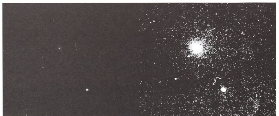
Fragment de la grande image, avant et après adaptation de l'histogramme.

Observatoire de Genève, CH-1290 Sauverny http://obswww.unige.ch/~behrend