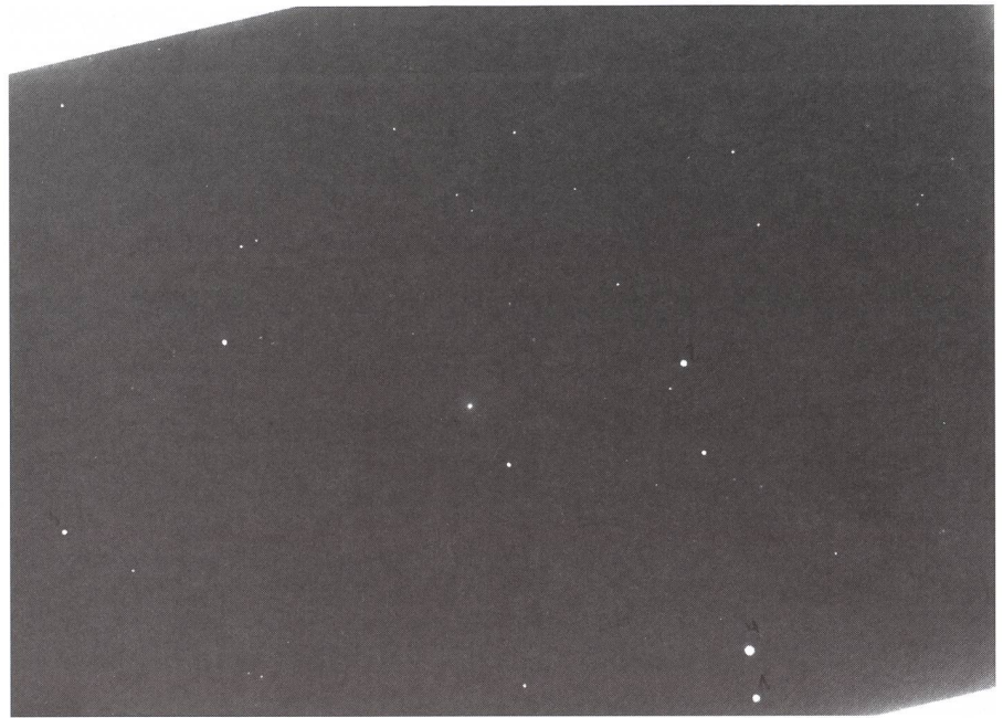
La photo OMG1147 a été prise par Armin Behrend, le 20 juillet 1990. Elle contient une trace de la région proche du noyau de la comète 1990 K1 Levy (point légèrement flou, au centre du cliché).

Essayons la méthode sur le cliché. Numérisation avec un scanner couleur à plat, en 300ppp et une image en tiff , regroupement des pixels en mode 2x2 et création d'une image en fits avec un logiciel personnel (bifs). Si l'on n'est pas convaincu de la présence d'une comète sur le cliché, une simple modification de