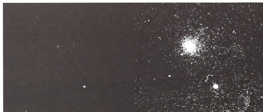
Fragment de la grande image, avant et après adaptation de l'histogramme.

Observatoire de Genève, CH-1290 Sauverny http://obswww.unige.ch/~behrend