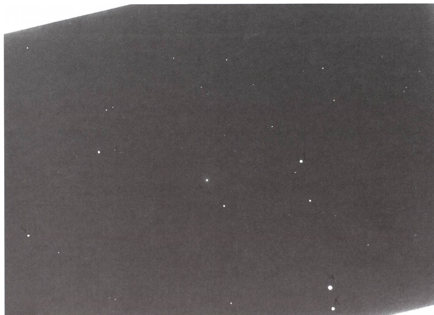
La photo OMG1147 a été prise par Armin Behrend, le 20 juillet 1990. Elle contient une trace de la région proche du noyau de la comète 1990 K1 Levy (point légèrement flou, au centre du cliché).

Essayons la méthode sur le cliché. Numérisation avec un scanner couleur à plat, en 300ppp et une image en tiff , regroupement des pixels en mode 2x2 et création d'une image en fits avec un logiciel personnel (bifs). Si l'on n'est pas convaincu de la présence d'une comète sur le cliché, une simple modification de