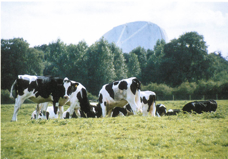
Le télescope Lovell Mark II s'élève dans les campagnes environnantes.

Il est intéressant de rappeler que le premier pulsar fut découvert non loin de Jodrell Bank, à Cambridge, par une équipe menée par ANTONY HEWISH en 1967. Il avait fait construire une petite antenne pour étudier le phénomène de scintillation interplanétaire, c-à-d les fluctuations en intensité d'une source radio distante dues aux effets perturbateurs de la couronne solaire. Son assistante, JOCELYN BELL, remarqua dans les enregistrements la présence d'une source scintillant de manière remarquablement régulière qui se répétait toutes les 24 h et transitait vers minuit, lorsque les perturbations de la couronne solaire étaient minimales. Après quelques mois d'observation, l'effet Doppler qui se révélait être en phase avec le mouvement orbital de la Terre confirma qu'il s'agissait d'une source lointaine et non d'un effet instrumental ou local. La découverte fut tenue secrète tandis que l'on nomma le phénomène LGM (Little Green Men) par perplexité ironique, tant la régularité de la pulsation semblait artificielle. Trois autres sources semblables furent découvertes et annoncées finalement en février 1968. La dissimulation de la découverte durant plusieurs mois