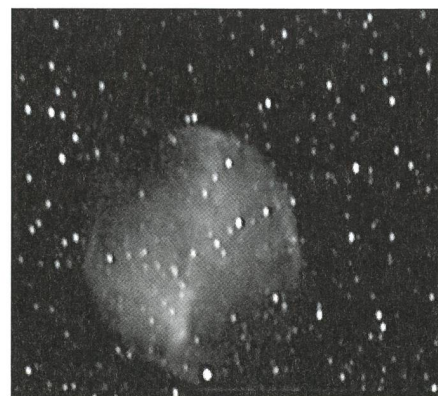
Figur 3: M27, Belichtungszeit 4 x 20 Sek. Alle Abbildungen mit Cookbook-CCD-Camera.