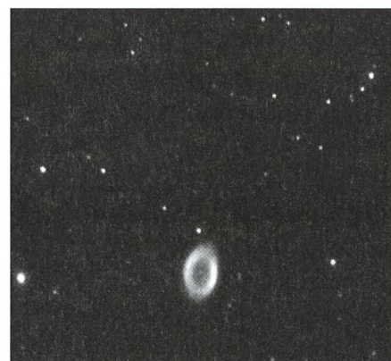
Figur 2: M57 mit Zentralstern, Belichtungszeit 5 x 30 Sek.