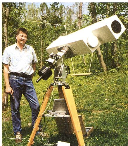
Der Autor mit einigen seiner selbstgebauten Geräte: Yolo-Schiefspiegler, Öffnung 150mm, F 1:12, parallaktische Montierung und Holzstativ

Man wird sich ob dem reichhaltigen Angebot von verschiedenen Herstellern astronomischer Instrumente, wie Teleskope, Montierungen, Kameras, Zubehör und kompletten Schutzbauten usw. mit Berechtigung die Frage stellen, ob der Selbstbau solcher Geräte noch sinnvoll ist.