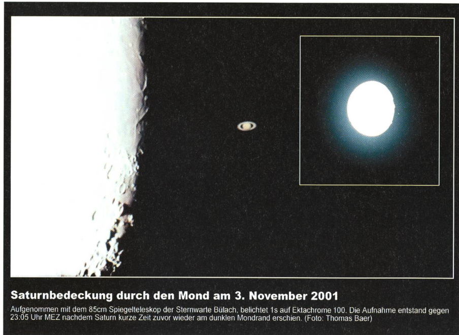
Saturnbedeckung durch den Mond am 3. November 2001

Astronomische Gesellschaft Zürcher Unterland CH-8424 Embrach