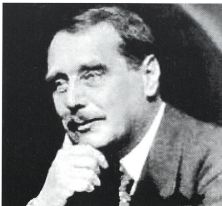
Fig. 1.: George Orson Welles (1915-1985).