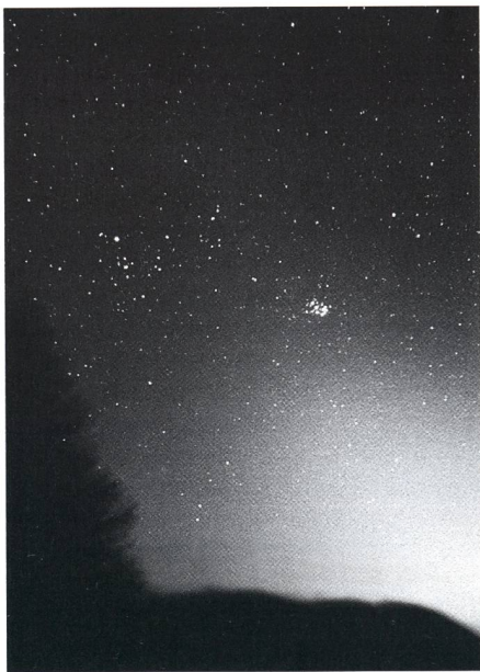
Offener Sternhaufen M45, auch genannt die Sieben Schwestern oder die Plejaden. Das ist einer der brilliantesten und uns am nächsten liegende offene Sternhaufen (ca. 400 Lichtjahre). Seine Grösse wird auf 13 Lichtjahre geschätzt, und er umfasst mehr als 3000 Sterne. Nach der Legende wären die Schleier die Rauchschwaden des Grossen Feuers, auf denen die Schwestern PETIT-THOMAS geritten sind, aber in Wirklichkeit sind dies die Nebel, aus denen sich die Sterne des Haufens gebildet haben.

Diese Schwestern PETIT-THOMAS waren fromme Wesen, die sechs älteren jedenfalls; die letzte war zur Zeit des