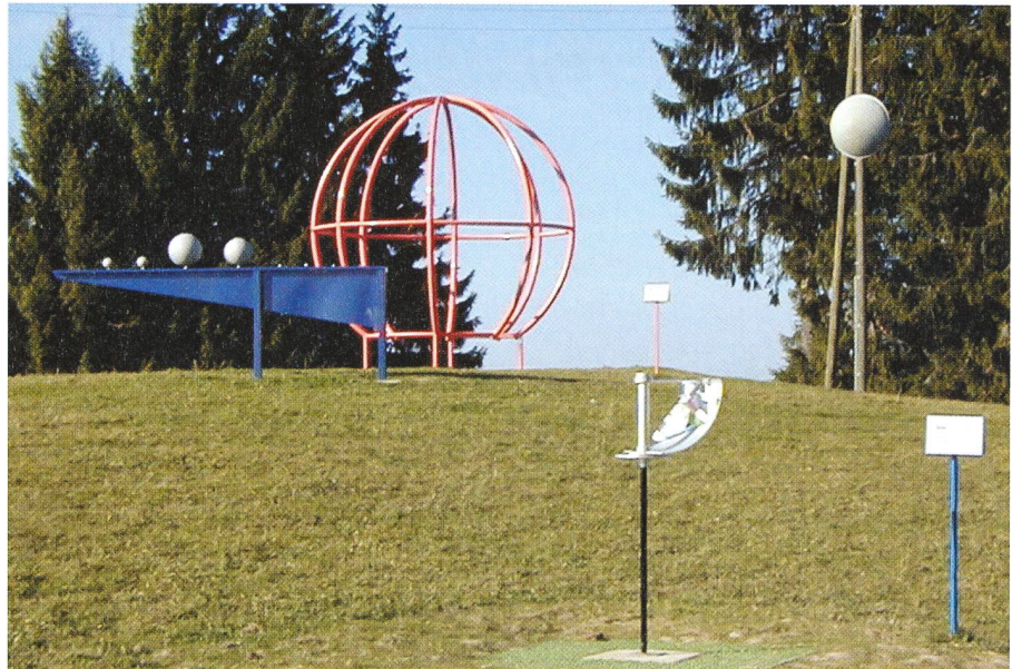
Le quadrant solaire et, au second plan, le Système Solaire. Der Sonnen-Quadrant und, im Hintergrund, das Sonnensystem.

Observatoire de Genève, CH-1290 Sauverny