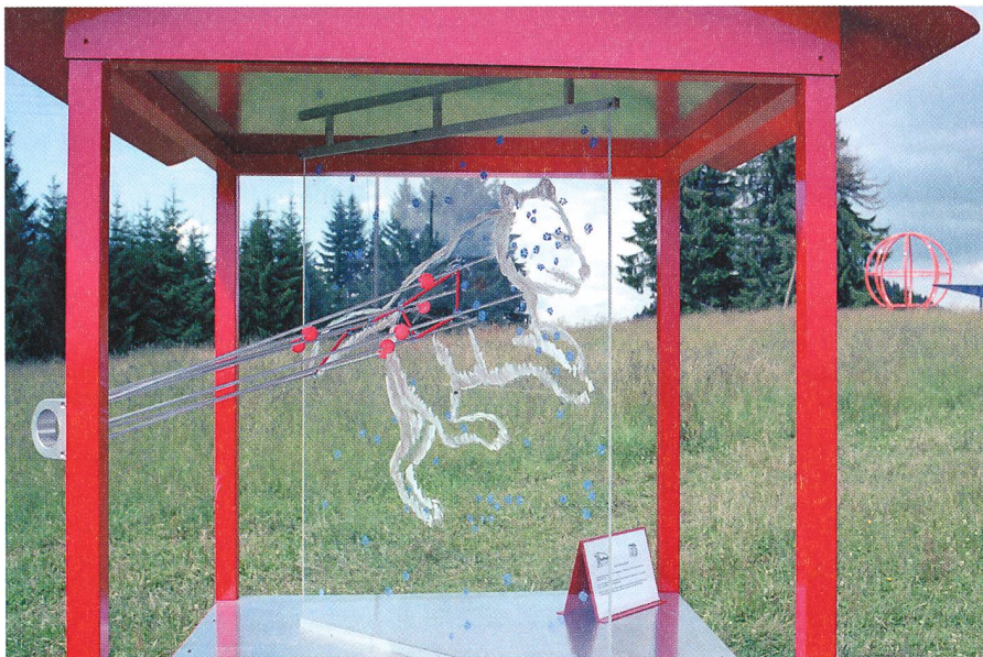
La Grande Ourse. Der Grosse Bär.

Der Rundgang erlaubt der Besucher-schaft, fundamentale Kenntnisse in der Astronomie zu erlangen. Entdecken Sie