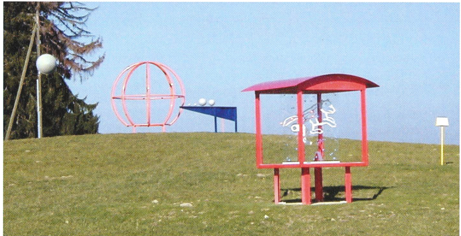
Le modèle «La Grande Ourse» avec, au second plan, «Le Système Solaire». Ein Modell des Grossen Bären, und im Hintergrund das Sonnensystem.