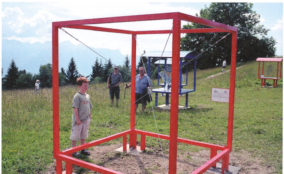
200 milliards d'étoiles, cela veut dire quoi? A cette question répond le modèle «Le sable de Jordanie».