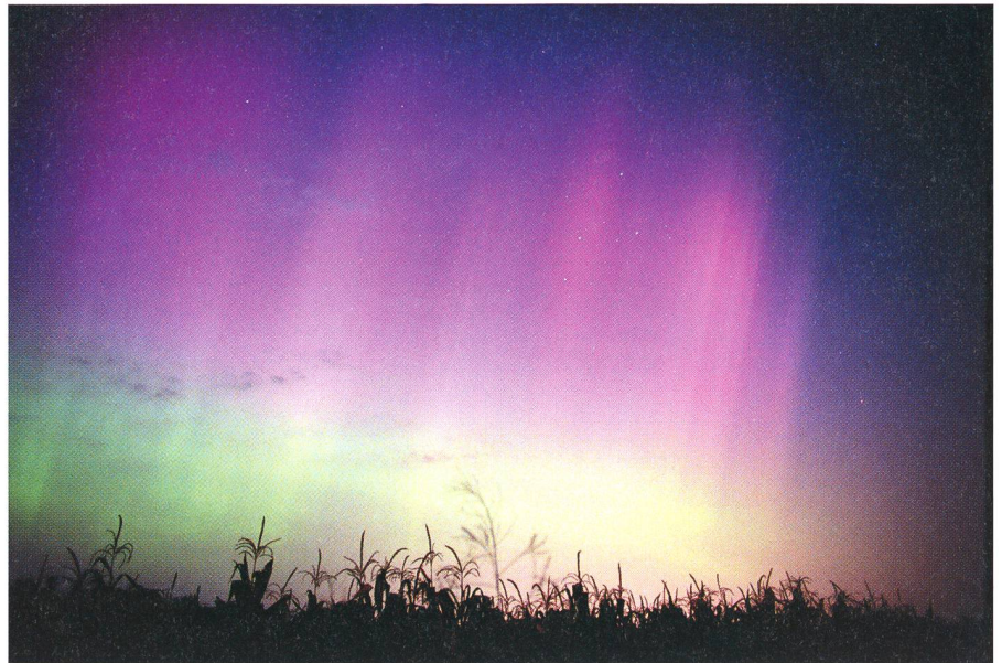
Aurora of 8 September 2002 at 01:07 UTC.

My location was near a growth of sweet grass which has a distinctly sweet smell. During the display, the sweet grass smell was overwhelmed by a less pleasant and pungent odor. There are no farms with animals within at least a kilometer of my location and there was no