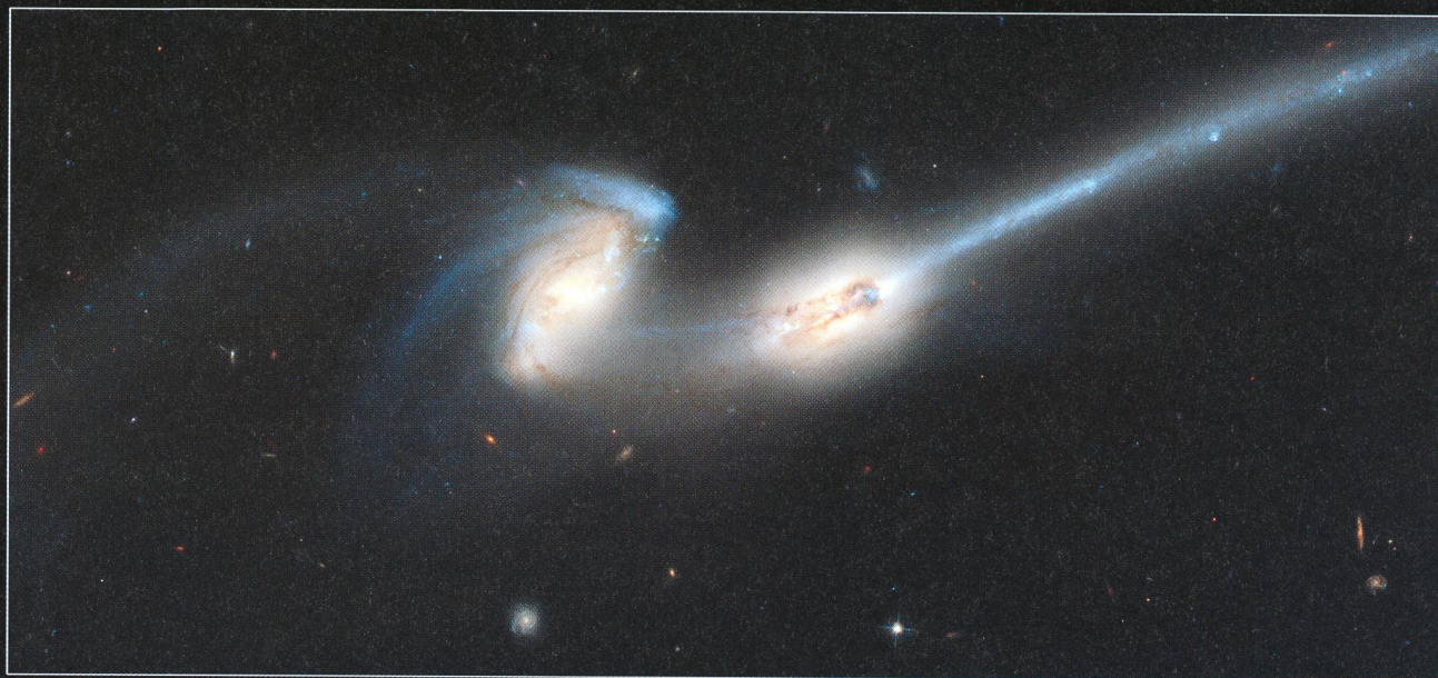
The Mice • Interacting Galaxies NGC 4676 Hubble Space Telescope • Advanced Camera for Surveys