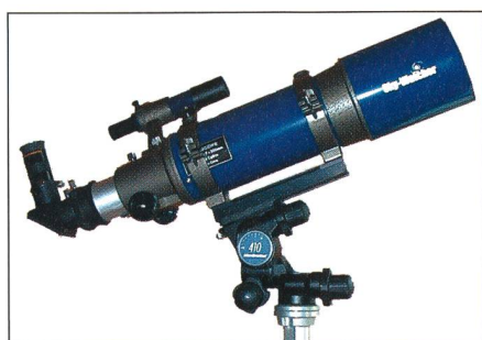
Fig.1: Antares R102/500 auf Manfrotto Junior Getriebeneigekopf 410 und Stativ.

Die Sky Watcher Modelle R102/500, R120/600 und R150/750 von Antares sind kurzbrennweitige lichtstarke Refraktoren identischer Bauart. Die Objektivöffnungen betragen 102mm, 120mm und 150mm und die Brennweiten entsprechend 500mm, 600mm und 750mm. Dies ergibt ein aussergewöhnlich lichtstarkes Öffnungsverhältnis von F/5 und ist für einen zweilinsigen Fraunhofer-Achromaten eigentlich eine (fast) unmögliche Konstruktion [2]. Leider entsteht deswegen ein starker Farbfehler. Trotzdem ist erstaunlich, was diese handlichen Refraktoren besonders bei schwachen Vergrößerungen zeigen. Bei der Verwendung von 2 Zoll Weitwinkelokularen (z.B. ein Panoptic 35mm ergibt beim R105/500 eine 14-fache Vergrößerung) wird man mit einem riesigen Gesichtsfeld von mehr als 4 Grad belohnt. Die Stärken die-