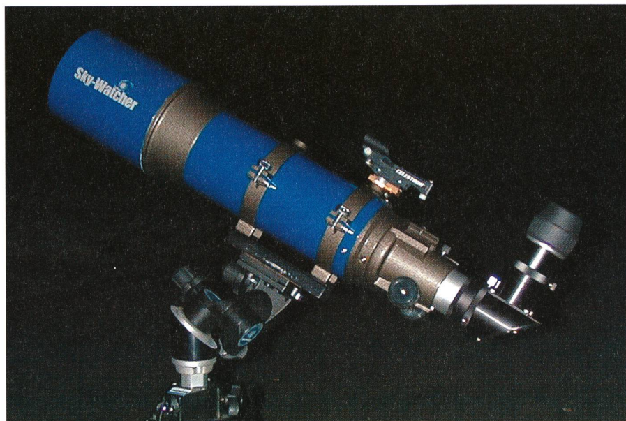
Fig.2: Antares R120/600 auf Manfrotto Junior Getriebeneigekopf 410, Polhöhenkopf für 47° und Manfrotto Stativ Triman 028.

ser kurzbrennweitigen Refraktoren sind: offene Sternhaufen, grosse Nebel oder der Blick in die Milchstrasse. Der Anblick des Nordamerika- und Pelikannebels durch den R120/600 mit einem 35mm Panoptic Okular und einem OIII-Nebelfilter ist ein atemberaubendes Erlebnis. Die Formen der beiden Nebel im gleichen Gesichtsfeld treten so klar und deutlich wie auf einem guten Schwarzweissfoto hervor. Bei stärkeren Vergrößerungen zeigen helle Sterne einen blauvioletten Lichthof. Erstaunlich ist aber, dass man Sternhaufen und Galaxien trotzdem sehr stark vergrössern kann; hier zeigen grosse Öffnung und Lichtleistung ihre Stärken. Was auch sehr gefällt ist die Klarheit und Deutlichkeit, mit der feinste Rillen und kleine Krater auf der Mondoberfläche erscheinen. Im direkten Vergleich mit einem Celestron C5 (ein Schmidt-Cassegrain Reflektor mit 125mm Öffnung und 1250mm Brennweite) zeigt schon der 102mm Refraktor bei gleicher Vergrößerung klarere und kontrastreichere Feinstrukturen auf dem Mond als das C5. Ebenfalls Doppelsterne werden sauberer getrennt.