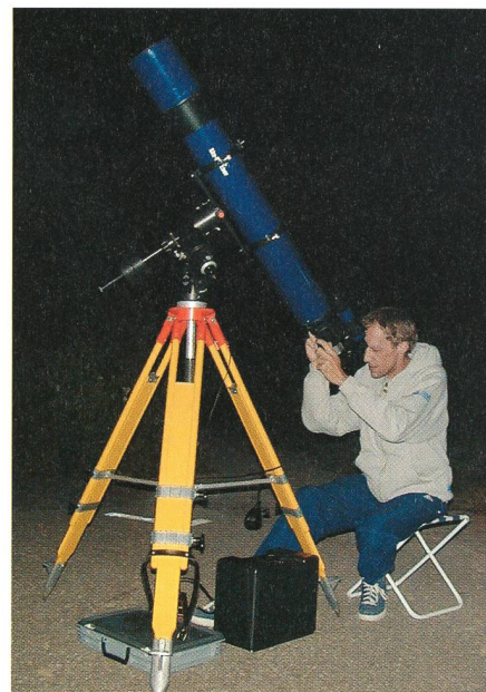
Fig.4: Antares R150/1200 auf GP-Montierung und G3-Harholzstativ.

Die mechanische Verarbeitung des Okularauszugs ist bei diesem Instrument recht gut. Im Gegensatz zu anderen Testberichten über dieses Teleskop [3], wo ein viel zu grosses Spiel bemängelt wurde, hat hier die Führung des Auszugs nur ganz wenig Spiel. Eigentliche Schwachstellen sind nur beim Zubehör festzustellen. Das mitgelieferte 1 1/4" Zenitprisma sollte auch bei diesem Instrument durch einen qualitativ guten 2 Zoll Zenitspiegel ersetzt werden. Langbrennweitige 2 Zoll Okulare bieten ein