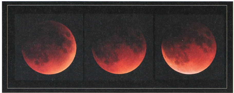
Totale Mondfinsternis am 16. Mai 2003

Astronomische Gesellschaft Zürcher Unterland CH-8424 Embrach