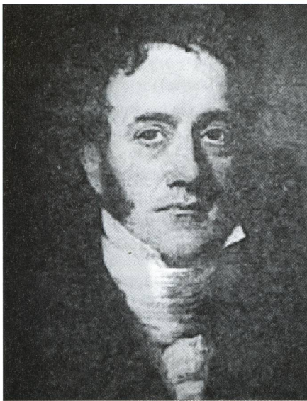
Sir JOHN HERSCHEL (1782-1871).

La revue «Sky & Telescope» publia dans ses numéros de septembre à novembre 1981 une série très intéressante d'articles sur une fausse relation d'observations lunaires prétendument faites en 1835 par JOHN HERSCHEL (1792-1871), fils de WILLIAM (1738-1822), à sa station du Cap de Bonne Espérance 2