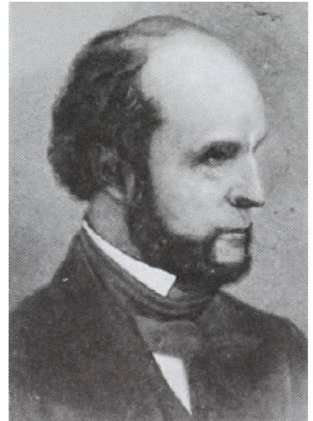
RICHARD ADAMS LOCKE (1800-1871), l'auteur du canular du «Sun».

Pour terminer, signalons que l'espièglerie de Locke fut appréciée par JOHN HERSCHEL lui-même et par l'Académie française des Sciences où les articles fu-